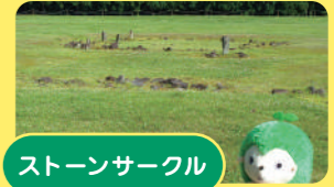
ストーンサークル